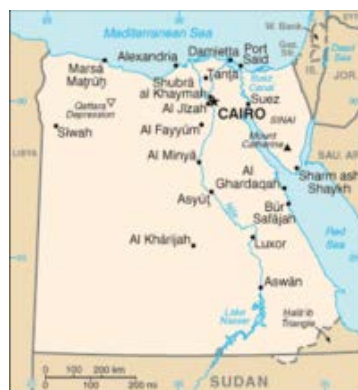
сл. 2 Карта Египта