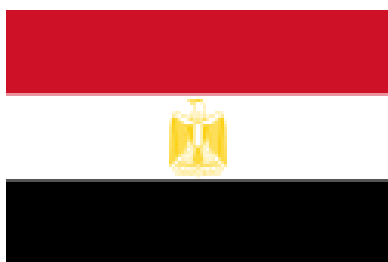
сл. 1 застава Египта

Република у североисточној Африци и југозападној Азији ( Синај ), с обалама на Средоземном и Црвеном мору. По површини 29, а по броју становника 17. од 195 држава света. Званичан назив је Арапска Република Египат, у којој је облик владавине председничка република и званичан језик је арапски. Египат је претежно пустињска земља у којој наплавна долина Нила с делтастим проширењем чини само 3% површине. Западно од Нила налази се већа Либијска пустиња са неколико депресија, на истоку је мања и виша Арапска пустиња, а на североистоку у азијском делу земље планинско-пустињско полуострво Синај. Клима је претежно пустињска с врло мало падавина које се смањују од обале Средоземног мора ка унутрашњости. Нил је једина стална река јер се храни водом у планинском тропском подручју богатом кишама. Плодна долина и делта реке имају карактеристике највеће и најнасељеније оазе у свету, где живи више од 98% становништва ове земље. Велика већина су Арапи, углавном сунитски муслимани; хришћана (Копти) има око 10%. Египат је најмногољуднија и друштвено најутецајнија арапска држава, иако економски заостаје за земљама богатим нафтом. Највећи економски значај има река Нил, у чијој се долини и делти добија по неколико жетви годишње. Велики значај има и морски пут кроз Суецки канал. Египат је водећа афричка држава по девизном приливу од туризма (атрактивне грађевине и стари споменици фараонског Египта).